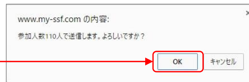
▲ メッセージ部分拡大図

※17時・22時の報告の際は、ともに前回報告時に入力したものを下回る数字は入力できません。 必ず前回以上の数字(=合計人数)を入力ください。